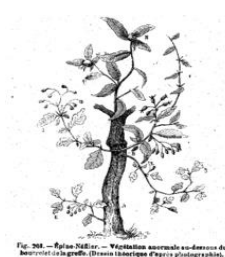
Fig. 266. — Rhus typhina . — Variété normale et greffage de branches de la greffe. (Dessin technique d'après photographes).

Greffage des arbres fruitiers : mythes et réalités par Bernard Messerli.